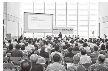
飯坂方部自治振興協議会の様子