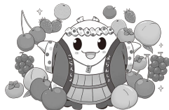
飯坂町マスコットキャラクター「ゆげお」