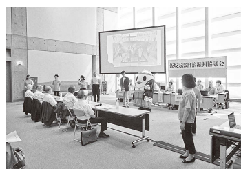
アイスブレイクの様子「ゆげお」も登場