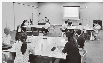
▲8月28日にコラッセふくしまで開催した第1回懇談会