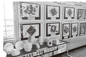
福島第二中学校の作品 7/13～8/9まで 展示

中央学習センターの玄関ホールに、福島第二小学校の児童の皆さんと福島第二中学校の生徒の皆さんが授業で取り組んだ作品を、日頃の学習成果として地域の皆さんや利用者の皆さんにも知ってもらうために展示しました。また、様々な作品は学習センターを活気あるものにし、玄関を華やかな雰囲気にかけています。これからも、不定期ですが展示する予定ですので、中央学習センターに来ていただき、子どもたちの作品をご覧になっていただければと思います。