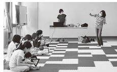
▲ロケットミミック