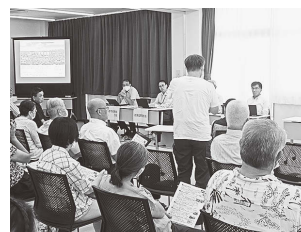
▲意見交換を行う様子