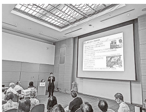
▲市長の市政説明の様子