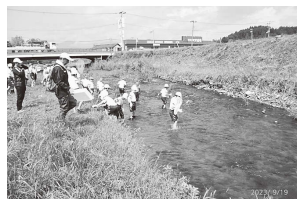
4年：水原川フィールドワーク