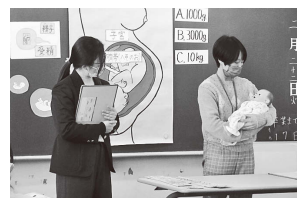
6年：二次性徴と命の誕生