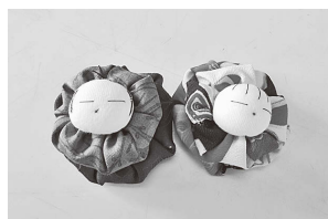
3・5年：つるし雛制作