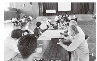
松陵中：異世代サミット