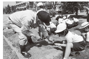
3年：ごんべ人参栽培