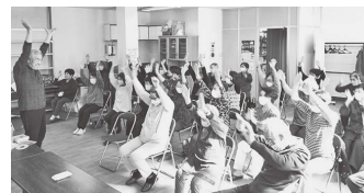
健康体操を行う「ひがしふれあいサロン」の会員

自分はフレイルかもしれない、どんな対策をすればよいか分からないなどの心配なことがあれば、お住まいの地区の地域包括支援センターへご相談ください。