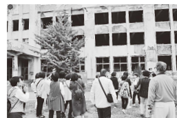
門脇小学校を見学する民生委員

地域の見守りなどを行う民生委員として、被災物を目の当たりにすることで災害の恐ろしさを実感するとともに、一命を取り留めた事例に触れ、防災訓練など日ごろの災害への備えがいかに大切なのかを再確認する研修となりました。