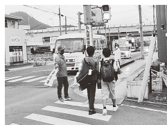
交通安全協会会員による街頭指導

市民一人ひとりが交通安全に対する意識を高め、交通ルールの遵守と正しい交通マナーを実践し、交通事故の防止に努めましょう。