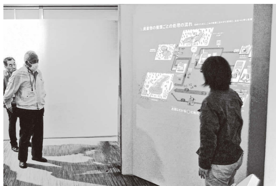
▲特定廃棄物埋立情報館リプルンふくしま