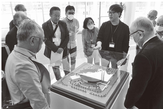
▲浅野燃糸(株)双葉事業所