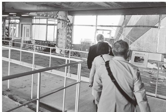
▲震災遺構 浪江町立請戸小学校