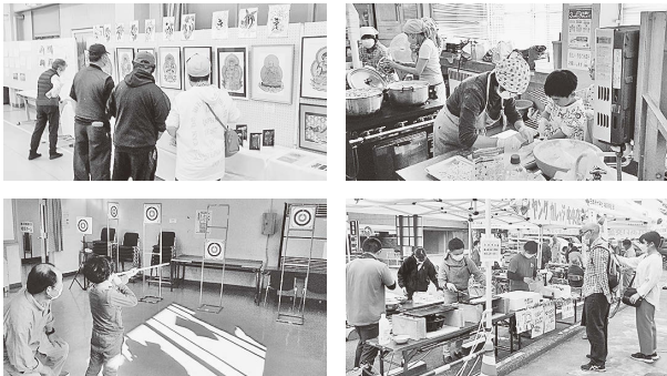
※芸能発表会の様子は次号でお伝えします

第54回中央地区文化祭が、11月3日(金)～5日(日)に開催されました。作品展示や子ども広場の体験コーナーのほか、4年ぶりに出店や売店も設けられました。団体・サークル、園児児童らの日頃の学習成果が披露され、多くの方が来館され、芸術の秋を堪能されました。