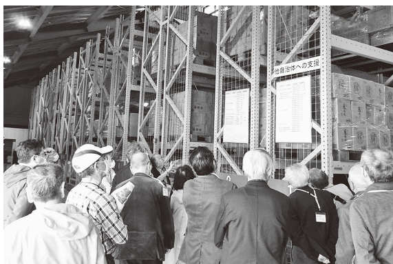
▲相馬市防災備蓄倉庫