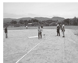
吾妻地区体育連盟 (ミニゴルフ大会)

秋の文化祭と活動発表会が最大のイベントですが、その他にも満月会や囲碁フェスティバル、吾妻地区体育連盟との共催事業として、ミニゴルフ大会、球技大会、カローリング大会などを開催しています。