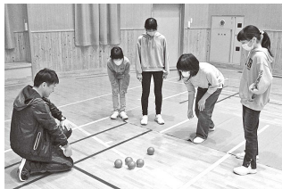
スノーラビット (ポツチャ体験)

小学4～6年生からなる「スノーラビット」は社会体験、自然体験、スポーツなどを行います。また、楽しい集団活動を通して、子どもたちの協調性、自主性の育成を図ります。