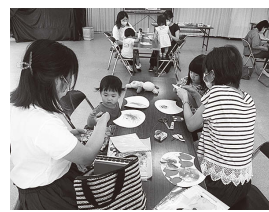
いちごクラブ (オリジナルうちわ作り)

「いちごクラブ」は1～4歳のお子さんとその保護者で月に1回程度、季節に応じた活動や楽しいリトミック親子ふれあい活動などを実施しています。親子の成長が活動に参加することにより実感できます。