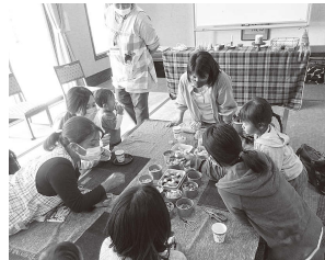
親子で楽しむキャンドル作り