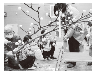
伝統行事「だんごさし」