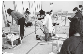
ブームワーカーで絶対音感