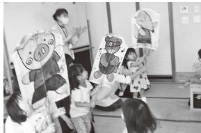
体いっぱい音を楽しんで