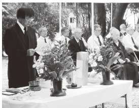
戦没者を追悼した参列者