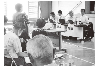
市長と地域の課題を話し合う委員