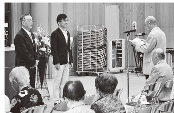
▲瀬上地区敬老会式典の様子