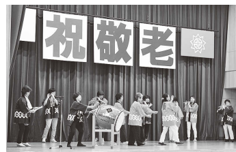
▲余目地区敬老会アトラクションの様子