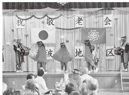
(大波地区：三匹獅子舞の披露)