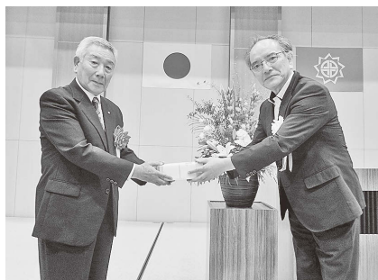
(東部地区：喜寿代表者の方へ記念品を贈呈)

9月14日に東部地区・同月16日に大波地区において、敬老会が開催されました。地区にお住いの77歳以上の方をご招待し、東部地区では338名・大波地区では76名の方にお越し頂きました。式典終了後に、東部地区では、おかやまこども園の子ども達による元気いっぱいのお太鼓の演奏やダンスの披露、会場の皆さんで、「おぼろ月夜」をはじめとする、日本の四季を歌うアトラクションが催され、馴染みのある音楽に包まれました。同じく大波地区でも市指定無形民族文化財の「三匹獅子舞」や、フラダンス、子供たちと一緒にのダンス、ジャディス、「魂福大波祈愛太鼓」が披露され、会場の皆さんでじゃんけん大会や新わらじおどりを踊るなど多くのアトラクションが催されました。来場された皆さんは、笑顔で楽しい時間を過ごされました。