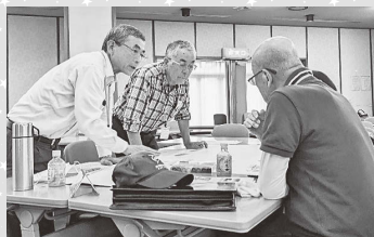
▲真剣に意見を交わす参加者