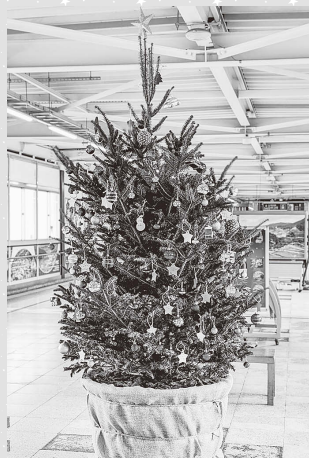
▲福島駅コンコースに設置したクリスマスツリー