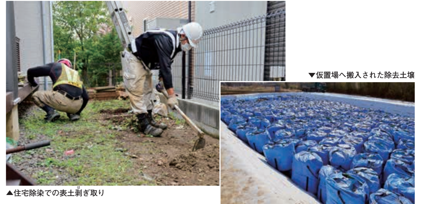
▲住宅除染での表土剥ぎ取り