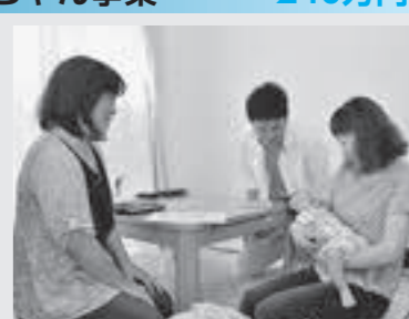
▶隊員を増員し、応援体制を強化

「こんにちは赤ちゃん応援隊」と保健師が連携して、生後4か月までの乳児がいる全ての家庭を訪問し、地域の子育て情報の提供などを行い、子育てを応援します。