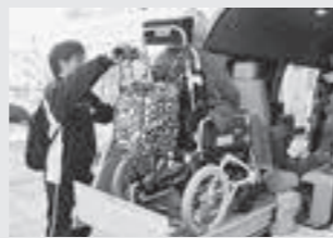
▲介護資格の取得を応援します

職員の資格取得など人材育成を図った介護事業所を支援するほか、学生や一般求職者を対象に介護資格取得費を補助し、介護現場のマンパワーの充実を図ります。