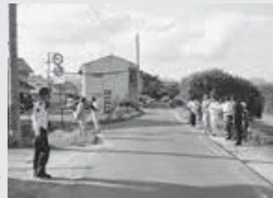
▶地域の皆さんと一緒に通学路を点検

緊急点検で確認した小学校の通学路などの危険箇所、交通安全施設を整備し、児童などの安全を確保します。