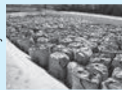
▶除去土壌などの搬入が進む仮置場

「ふるさと除染実施計画」の優先度に基づき、引き続き面的に住宅の除染を進めるほか、公共施設や地域から要望のあるホットスポットについても優先的に除染を実施します。また、仮置場へ除去土壌の搬入が可能となった地区から通学路や側溝などの除染を順次進めるとともに、新たな仮置場の設置により、除染のさらなるスピードアップを図ります。