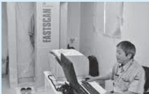
▲検査は2分程度で終了します

長期的な健康管理を進めるため、妊娠中の方や中学生以下のお子さんを対象に個人線量計(ガラスバッジ)による外部被ばく線量の測定を行ってききましたが、今年度は16歳以上で希望される方も対象になります。測定時期は、昨年と同様、秋頃を予定しています。対象の方へは個別に案内通知を送付します。ぜひお申し込みください。