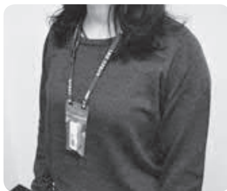
▲体の外から受ける放射線量を測定するガラスバッジ

長期的な健康管理を進めるため、妊娠中の方や中学生以下のお子さんを対象に個人線量計(ガラスバッジ)による外部被ばく線量の測定を行ってききましたが、今年度は16歳以上で希望される方も対象になります。測定時期は、昨年と同様、秋頃を予定しています。対象の方へは個別に案内通知を送付します。ぜひお申し込みください。