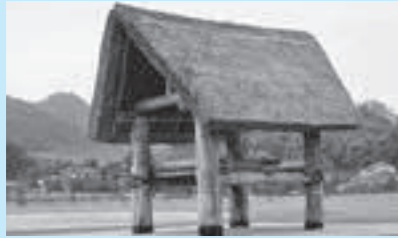
▲復元された直径90cmの柱を使った掘立柱建物

一直径90cmの巨大な柱— 全国でも最大級の太さで、1本の重さは約3トンの巨大な柱。なぜこのような巨大な柱を宮畑の地に建てなければいけなかったのでしょうか？