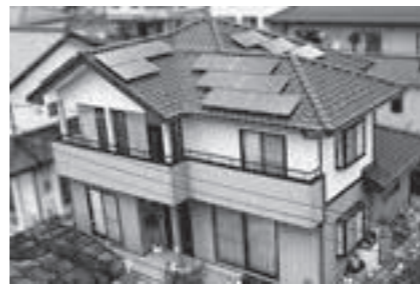
▲太陽光発電システムを設置した住宅