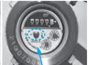
パイロットマーク