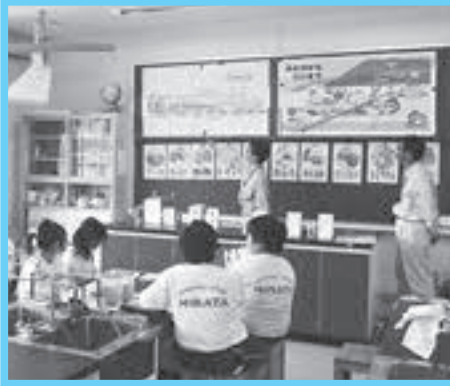
▲水道への理解を深めます

水道出前教室は12月19日まで（土・日曜日、祝日を除く）開催します。受講を希望する団体（主に小学生）は、下記電話番号までお問い合わせください。