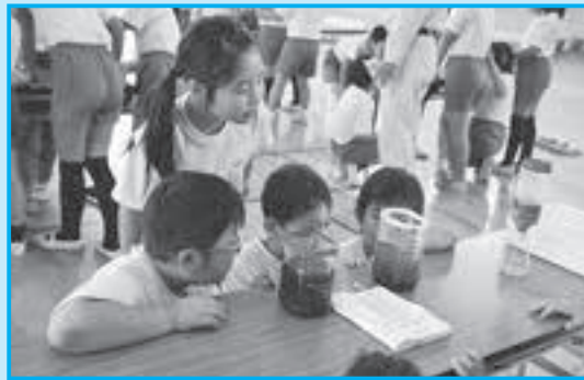
▲どっちの水がきれいになったかな？