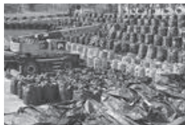
◀除染で発生した除去土壌の搬入が進む市内の仮置場

●ふるさと除染実施事業……………541億3,218万円 (住宅や道路の除染、仮置場の設置など)