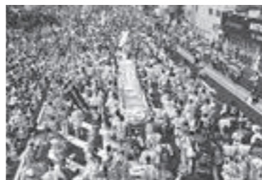
▶東北の県庁所在都市のまつりが集結し、観客の皆さんを魅了しました