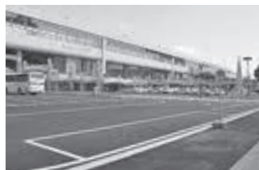
◀市民や観光客の皆さんの利便性向上のため、リニューアルが進むJR福島駅西口駅前