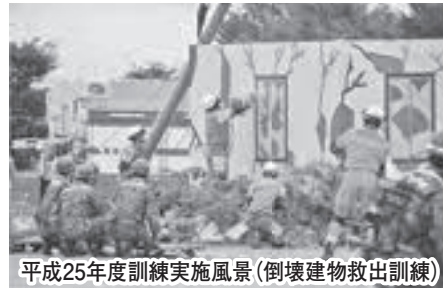
平成25年度訓練実施風景(倒壊建物救出訓練)

■と き／10月18日(土) 午前8時～午後0時15分 ※天候により訓練が中止になる場合があります。