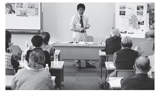
▲水道局の職員が直接伺います