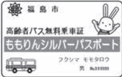
▲ももりんシルバーバスポート