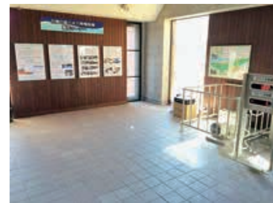
▲建物の中では発電の仕組みを学べます

天候に左右されず、子どもたちがのびのびと自由に外遊びができるように四季の里荒井字上鷲西1-1-1園内に屋根付き運動広場がオープンしました。 また、市公共施設として初となる「小水力発電設備」も、(株)中川水力(飯野町明治)のご協力をいただき設置しました。ぜひお越しください。 ◆利用時間 ●屋根付き運動広場 午前9時~午後5時 ●小水力発電展示コーナー 午前9時~午後4時 ※混雑時は入場を制限することがあります。係員の指示に従ってください。 ◆休園日 年末年始と施設点検日を除き無休 ◆入園料/無料 ◆問 〈屋根付き運動広場〉 農業振興課 ☎525-3727 〈小水力発電設備〉 環境課 ☎525-3742 ◆施設共通 ※混雑時は入場を制限することがあります。係員の指示に従ってください。