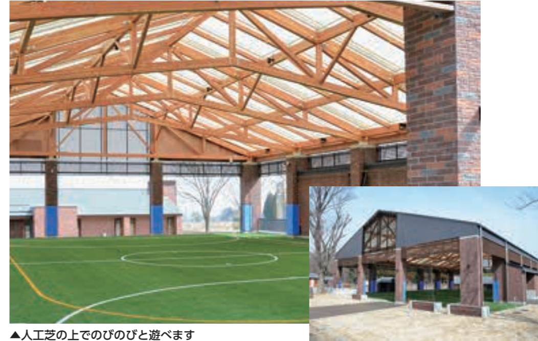
▲人工芝の上でのびのびと遊べます