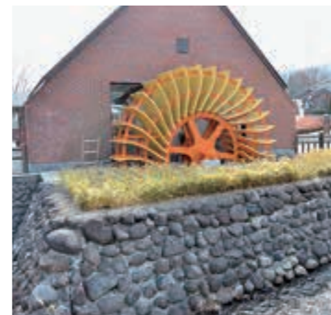
▲新たに設置したオレンジ色の水車