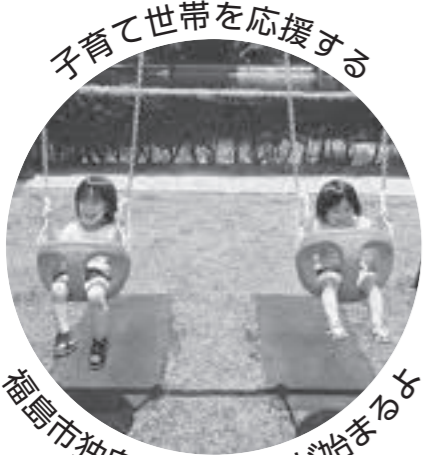
子育て世帯を応援する

■申請方法／11月上旬に対象の世帯に申請書と返信用封筒を送付します。申請書類に必要事項を明記の上、必要書類を同封の