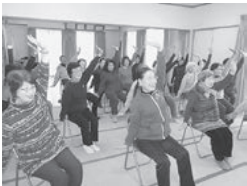
▲体操に取り組む町内会の皆さん