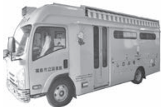
▲新しい「しのぶ号」が各地区を巡回します

※詳しい巡回コースや日程は、市立図書館ホームページや図書館だよりでご確認いただくか、お問い合わせください。