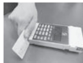
▲専用の端末機にキャッシュカードを通し、暗証番号を入力するだけ