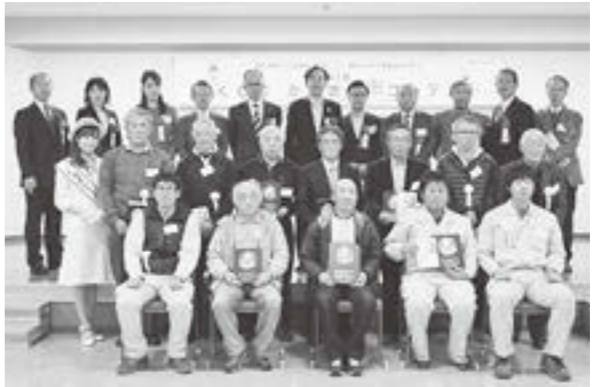
▲受賞された皆さんとコンテスト関係者