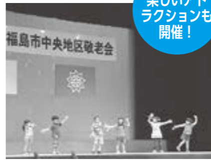
【各地区敬老会の開催日時】