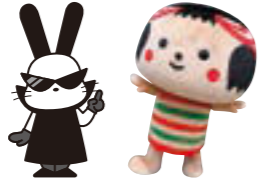
▲ブラックもりんときぼっこちゃんがやってくる!

時 午前10時～午後4時 ※5日は午後3時まで。 【空いっぱいこのぼりクイズ】 何匹泳いでいるか数を当てて豪華賞品をゲットしよう! ☆3日(水・祝)☆ ●ブラックもりんときぼっこきぼっこちゃんと遊ぼう ①午前11時②午後2時 ●よさこい演舞 ①午後1時②午後3時 ☆4日(木・祝)☆ ●若手人気ジャグラー悠雲 ①午前11時②午後2時 ●もりっ人アンドセントくんのバルーンと歌のコラボショー 午後1時 ※午後3時からはバルーンプレゼント。 ☆5日(金・祝)☆ ●バルーンパフォーマー風船の国のアリス ①午前10時30分②午後1時 ●ウルトラマンゼロミニショー ①午前11時②午後2時