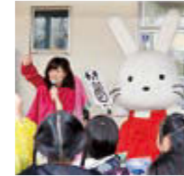
▲じゃんけんの勝者20人にはプレゼント有り