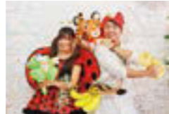
▲もりっ人アンドセントくん