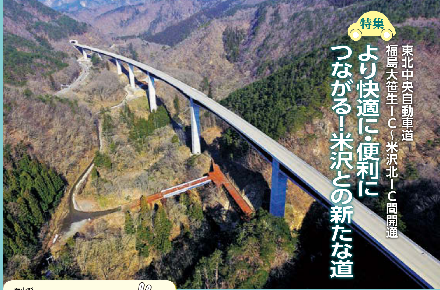
▲地上約80mを走行する中野大橋