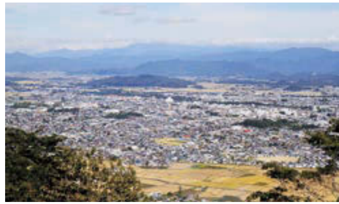
▲秋の米沢市の全景