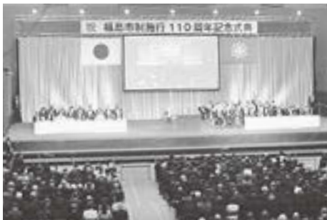
▲多くの人で110周年をお祝いしました