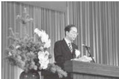
▲式辞を述べる市長