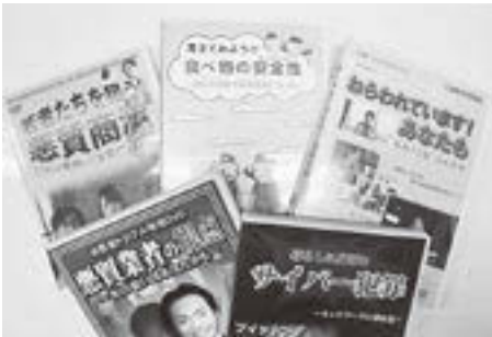
▲貸し出ししているDVDの一部

■ 内容 / 消費生活上のトラブルを学ぶビデオ・DVD教材などを貸し出しています。町内会や地域の団体、サークル、PTA、学校の授業など皆さんの学習にご利用ください。