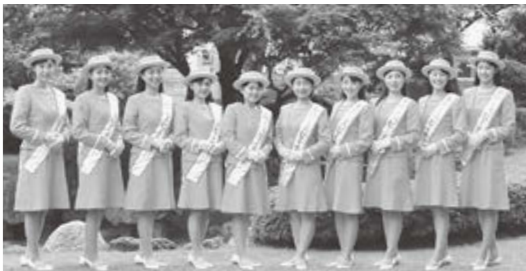
▲2017ミススピーチキャンペーンクルー

農業振興室、各支所・出張所・学習センター、市内の大学・短大・スーパーマーケットなど(希望者には郵送も可) ※県くだもの消費拡大委員会ホームページからダウンロード可。