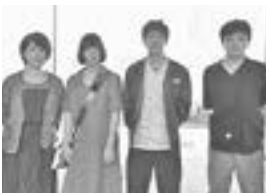
チーム名：カノンノ

土湯温泉の至る所で見掛けた「こけし」。ゆるキャラはもちろん、プリンやマンホールにまでいるこけしたちは、一体どれほどいるんだろう？単純な疑問を追求した。