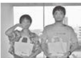
チーム名：どうぶつヨーチ

モモ・円盤餃子、こけし、温泉など魅力的なものはいっぱいあったが、真に引かれたものは、出会った皆さんの「シャイだけど愛があってまっすぐ。だけどシャイ。」口下手だけどチャーミングな「人柄」をアピール。