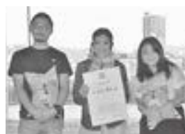
チーム名：リハビリアーツ学院

面白いところがたくさんあるのにあまり知られていない。有名じゃない。ロケハンで訪れた場所が楽しすぎて「自慢したいけど秘密にしたい」と思ったことを表現した。