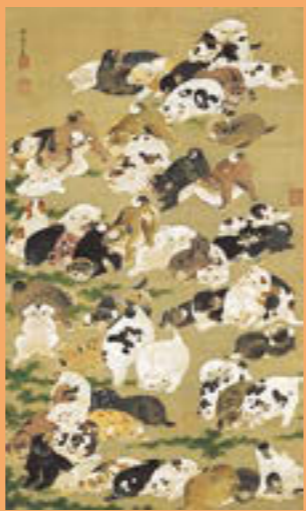
〈百犬図〉絹本着色 寛政11年(1799年)個人蔵

※団体は20人以上。高校生以下は無料。 ※身体障害者手帳、療育手帳、精神障害者保健福祉手帳をお持ちの方は企画展・常設展とも無料(身障・療育手帳は第1種、保健福祉手帳は1級の場合、付き添いの方1人も無料)。 ※学生の方は、チケット購入の際に学生証のご提示をお願いします。 ※前売券は、県立美術館、中合福島店、ファミリーマート、セブンイレブン、ローソンなどで3月25日(月)まで販売中です。詳しくはお問い合わせください。