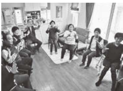
▲自宅で体操に取り組む「元気会(吾妻地区)」の皆さん