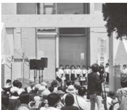
▲多くの来場者で賑わう記念館

程度の研修を2回実施予定。内容は事業の説明や創作詩の作り方、朗読の仕方など。日程は参加者決定後に連絡します。 ■申し込み方法／①氏名②住所③電話番号を明記の上、自作の詩(テーマ「私のふくしま」)を添えて、定住交流課窓口かフアックス、郵送で ■申込期間／4月12日(金)まで(当日消印有効)