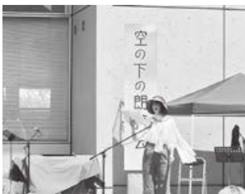
▲昨年の本市からの参加者