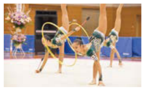
◀日本代表のクラブ・フープ競技演技

東京2020大会でも活躍が期待されるフェアリージャパンPOLAを応援しましょう！