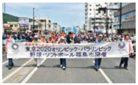
▲東北絆まつりではパレードに参加して東京2020大会をPRした市民応援団

2020ふくしま市民応援団は、東京2020大会を「支えたい」「応援したい」という気持ちを持つ方に登録していただき、それぞれの立場・できる範囲内で、気軽に応援活動を行っています。