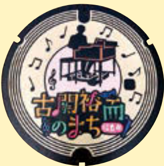
▲デザインマンホール