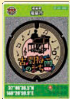
▲マンホールカードの 完成イメージ