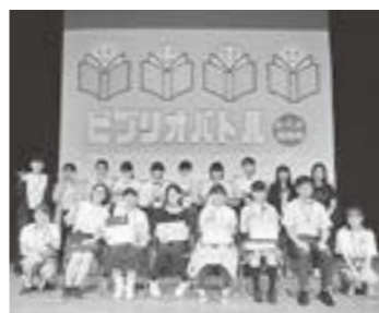
▲第4回表彰式の様子