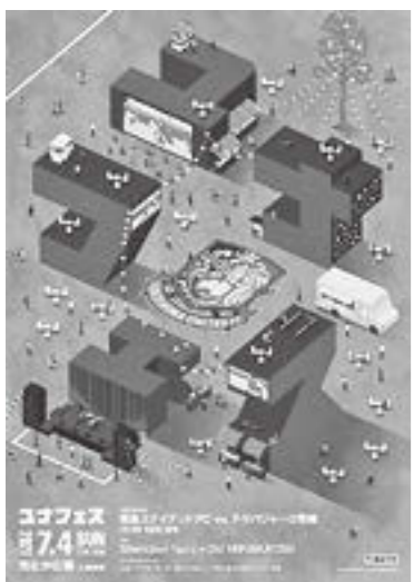
※新型コロナウイルス感染症対策を講じ、運営します。