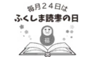
▲図書館の福の神ふくもっちゃん