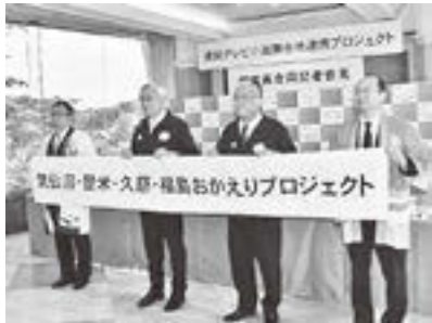
▲5月22日4市合同記者会見の様子