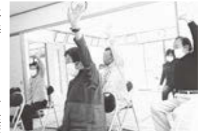
▲マスクを着用しながら体操に取り組み「わかばの会(飯野地区)」の皆さん

■募集期間 随時受け付け ■申し込み方法 お住まいの地区の地域包括支援センターに電話で相談の上、お申し込みください。