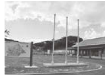
▲市パークゴルフ場