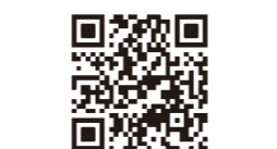
いきいきももりん体操は市公式YouTubeで公開中!

■募集期間 随時受け付け ■申し込み方法 お住まいの地区の地域包括支援センターに電話で相談の上、お申し込みください。