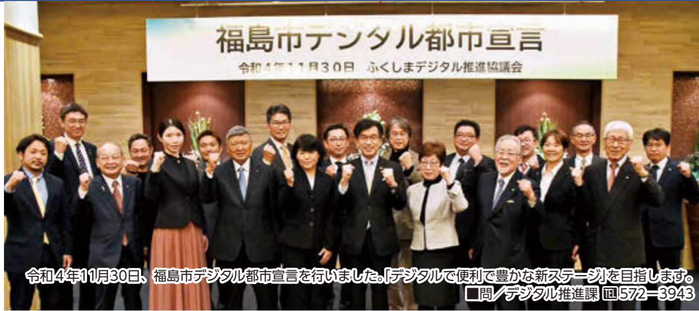
令和4年11月30日、福島市デジタル都市宣言を行いました。「デジタルで便利で豊かな新ステージ」を目指します。 □問/デジタル推進課 ☎572-8943