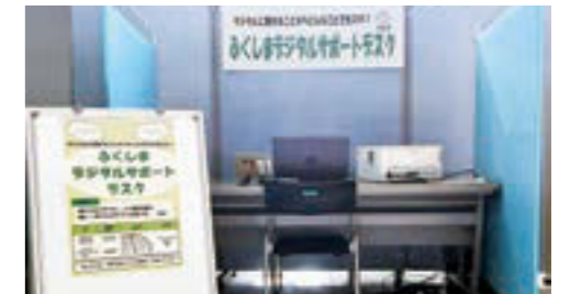
▲対面方式でデジタル活用のお困りごとに丁寧に対応します。

■申し込み方法/右記QRコードからオンライン予約またはコールセンター(☎090-7301-0951)へ電話で ※開催日の3日前までにお申し込みください。