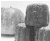
▲カヌレ・ルージュ (カフェドフルール)