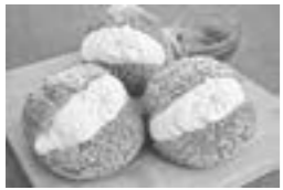
▲りんごのシューアイス (マン・ドゥ・シャトン)