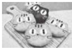
▲茶トラのポンム (マン・ドゥ・シャトン)