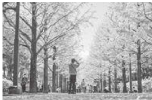
【あづま総合運動公園のイチヨウ並木】