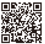
▲「ふくしまスイーツ プレミアム」 公式サイト