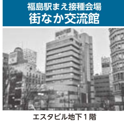
エスタビル地下1階