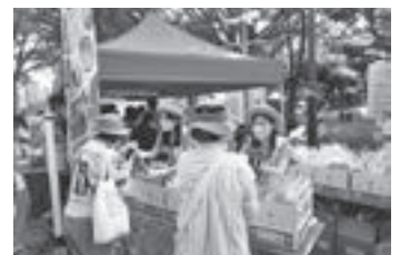
▲各地で大人気の物産PRイベント

福島の顔として、くだものだけでなく、県全体の魅力を発信する役割と責任があります。活動に必要なスピーチの仕方や接遇、農業などの知識はしっかりと研修を受けることができるので、「福島力になりたい！」という熱い思いを持った方には、ぜひ勇気を出して応募してもらいたいです。たくさんのご応募をお待ちしております。