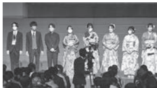
▲令和4年度二十歳の集いで発表する企画委員