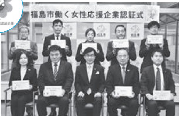
(上段左から)①、②、③、④、⑤ (下段左から)⑥、⑦、市長、⑧、⑨