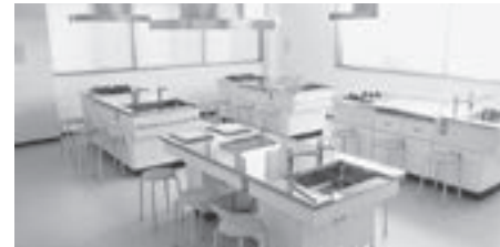
実習室 調理台を5台設置し、内1台は車いす対応型(昇降機能付き)