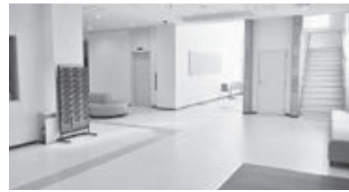
エントランス 広々としたエントランスで、西面をガラス張りとし、明るく温かみのある空間