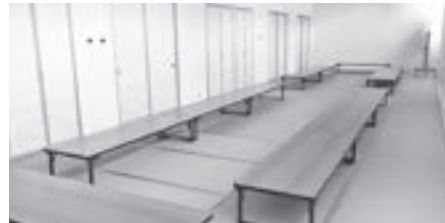
和室 南側に面し明るい日差しを取り入れ、落ち着きや安らぎを感じられる部屋。茶道の炉壇も設置