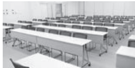
講義室・研修室 講義室と研修室1は可動間仕切り開放で120人の講座にも利用可能。研修室2・3は、個人学習でも利用可能