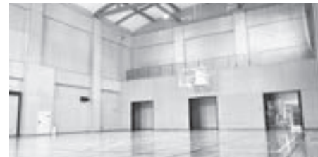
大ホール 家庭バレーボール、バドミントン、卓球やポッチャなどに利用可能。折り畳み式ステージもあり、文化・芸能発表も可能