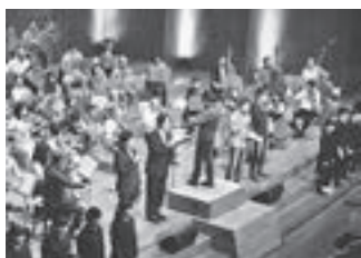
▲平成30年11月4日に開催した古関裕而記念音楽祭