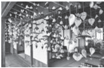
▲古民家とつるし雛