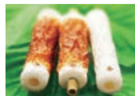
両端が白く真ん中が こんがりの豊橋ちくわ