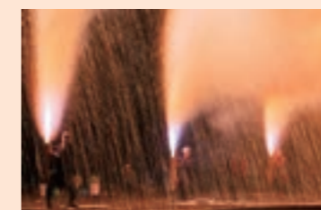
ふくしま花火大会で披露された 豊橋手筒花火