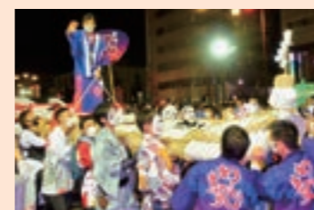
ええじゃないか豊橋まつりに わらじまつりが参加

未来へ共に歩むパートナーとして協力し合いながら、共に発展していくことを目指す協定です。今後、文化や産業、防災、教育など幅広い分野で官民の連携強化を図っていきます。