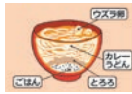
豊橋カレーうどん