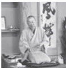
▲落語家による防犯落語講座