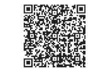
▲詳しくは市ホームページをご覧ください