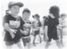
▲特色ある幼児教育・保育