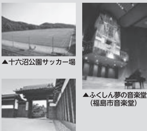
▲十六沼公園サッカー場