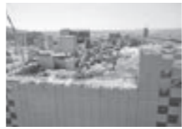
▲市内最大規模の再開発。解体するビルは小学校の校舎の約16倍