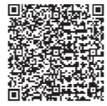
▲詳しくは市ホームページをご覧ください。