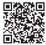
▲詳しくは市ホームページをご覧ください。