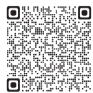
▲詳しくは市ホームページをご覧ください。