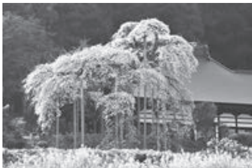
【慈徳寺の種まき桜】