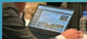
▲資料はデータ配信により ペーパーレス化