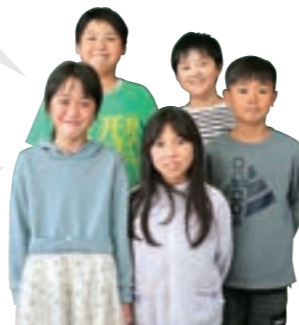
渡利小学校 4年生の皆さん

調べものがしやすかったり、勉強しながらタイピングを覚えられたりするのが良いところです。