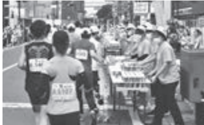
▲ボランティアの皆さん