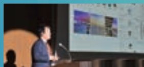
▲市内企業3社が事例発表