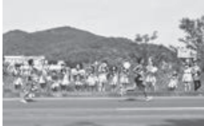
▲ランナー応援隊の皆さん