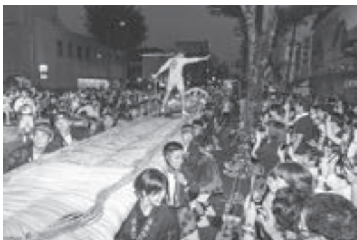
【福島わらじまつり】