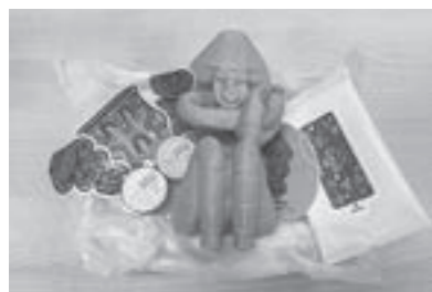
▲ベストランナーには、しゃがむ土偶ぴ〜ぐ〜のレプリカなどのグッズ詰め合わせをプレゼント!